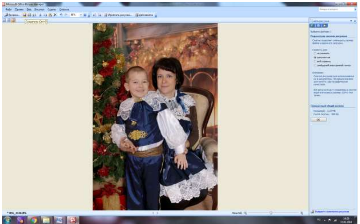
Фото для отправки готово.